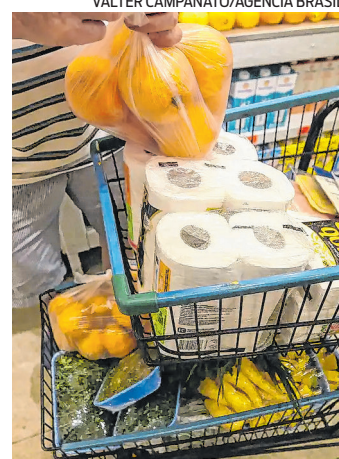
Aumento maior foi em Manaus