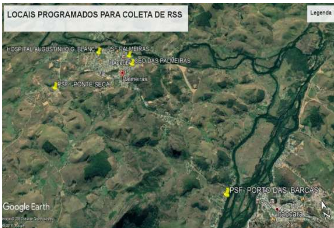
Figura 1 - imagem Google Earth contendo locais de coleta de RSS